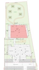
PLAN MASSE DE REPERAGE