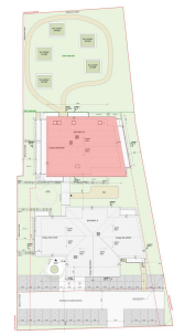
PLAN MASSE DE REPERAGE