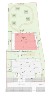
PLAN MASSE DE REPERAGE