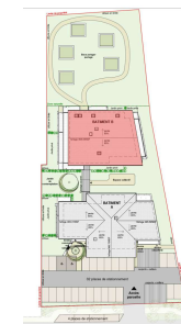
PLAN MASSE DE REPERAGE