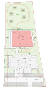
PLAN MASSE DE REPERAGE