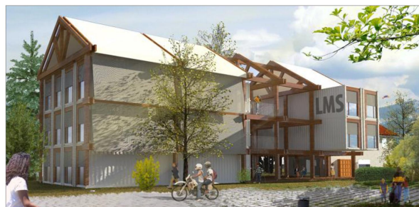
Un "projet d'habitat modulaire" réalisé à partir de conteneurs assemblés les uns aux autres.

Limiter l'empreinte écologique laissée sur les paysages, offrir aux occupants une architecture moderne et de qualité, laisser plus de latitude sur le foncier. Pour Savoisiennne Habitat, il était temps que le bâtiment reflète les tendances sociétales. À l'instar des initiatives réalisées en Europe du Nord, la coopérative souhaite proposer à l'avenir des opérations d'habitat modulaire, réalisées avec des conteneurs maritimes transformés en logements.