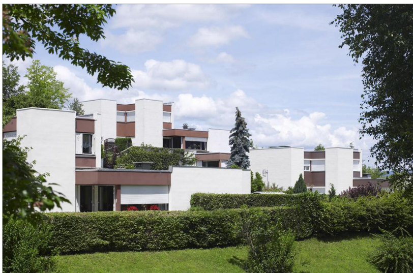
L'esprit de Savoisiennne Habitat : donner un logement à tous, comme avec le projet immobilier de La Chevalière à Bissy.

Néanmoins, c'est en 2000 que Savoisiennne Habitat va prendre le visage qu'on lui connaît aujourd'hui. Celui d'un bailleur de logement social, au sens noble du terme, développant une activité de promoteur constructeur offrant des logements adaptés à la demande, aux besoins, et aux porte-monnaie des accédants. Une entreprise à taille humaine, qui, au-delà de bâtir un pont entre le passé et le présent – avec des opérations de revalorisation de biens en ville ou en allant vers des concepts de logements évolutifs, participatifs – pour autre ambition d'être un acteur majeur dans l'aménagement et la mise en valeur de nos territoires de plaines et de montagnes. Cet anniversaire, placé sous le